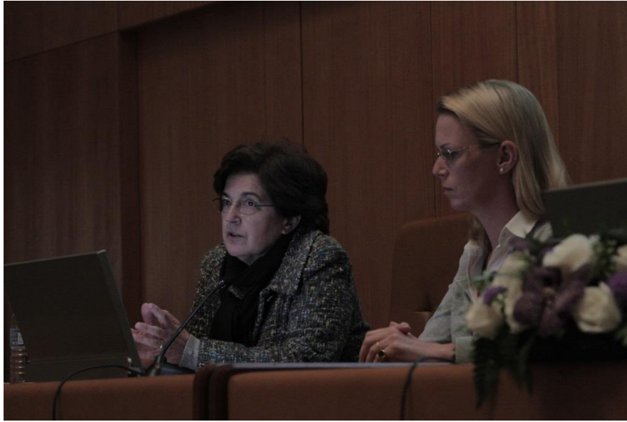
Photo 4: Dra Ana Jorge, IYCF Coordinator, Head of Baby Friendly Hospital Initiative Portugal and 2 x Health Minister